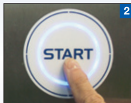
2 Buzzer - Schnellstart- Taste für das meist- benutzte Spülprogramm