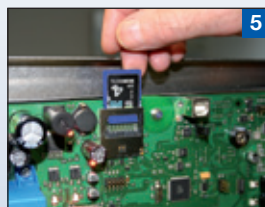
5 Datenlogger zur Prozessdokumentation auf SD-Karte (bis 4 GB)