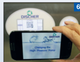
6 QR-Code vom Geräte- Display lädt Video- Tutorials auf das Smart- phone der Haustechnik