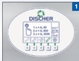
1 Bedienerfreundliches VGA-Display mit Anzeige aller gewünsch- ter Betriebsparameter