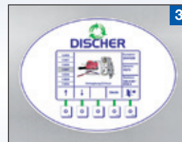
3 Alle Ersatzteile des Kata- logs sind im Display der Automaten aufrufbar